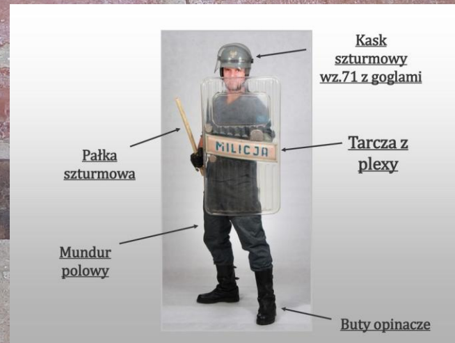
Zmotoryzowane Obwody Milicji Obywatelskiej