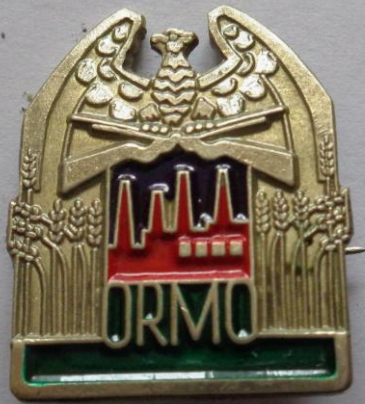
Ochotnicze Rezerwy Milicji Obywatelskiej

Ponieważ Polacy są mądrym narodem szybko zorientowali się, że nie jest dobrze. Niezadowolenie przerodziło się w strajki, głównie w zakładach pracy. Wojsko i milicja musiała stanąć naprzeciw strajkom brutalnie je tłumiąc. Szczególnie w pamięci utkwily dwie formacje- ZOMO i ORMO.