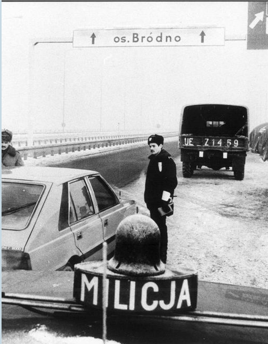
KI WA. STAN WOJENNY 13/12/1981